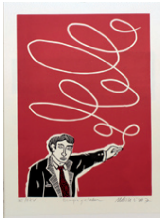
B 7116-13/10 Rahmenmaß 70 x 50 cm Moritz Götze, Energiegeladen, 2007, Hochdruck, 55 x 40 cm