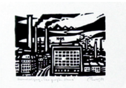
B 6295-10/96 Rahmenmaß 30 x 40 cm Lothar Rentsch, Das Große Haus, 1984, Linolschnitt, 8 x 11 cm