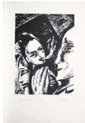
B 6824/06 Rahmenmaß 80 x 50 cm Uwe Bösch, Straßenszene, 1985, Lithografie, 49 x 36 cm