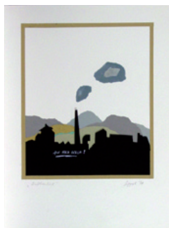
B 1244/80 Rahmenmaß 40 x 30 cm Gerald Sippel, Aufbau lied, 1978, Collage, 28 x 24 cm