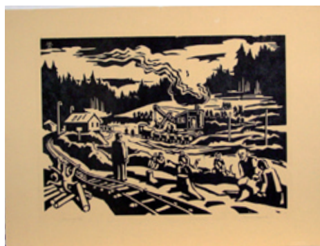
B 5024/85 Rahmenmaß 45 x 60 cm Rudolf Manuwald, Arbeitseinsatz Talsperren- bau Cranzahl, o.J., Holzschnitt, 35 x 46 cm