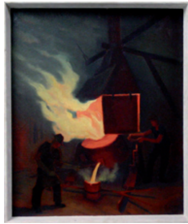
A 0507/85 Rahmenmaß 62 x 52 cm Bernhard Paul Mehnert, An der Gießpfanne, o.J., Öl auf Leinwand, 60 x 50 cm