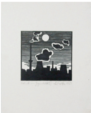
B 0072/75 Rahmenmaß 40 x 30 cm Peter Schettler, Fabrik im Gegenlicht II, 1973, Holzschnitt, 24 x 30 cm