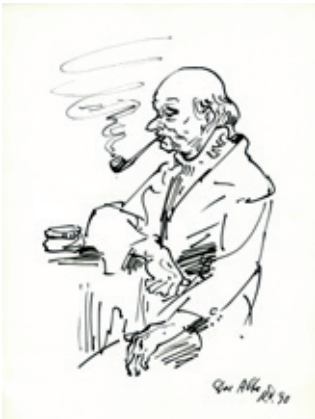
B 7403/15 Rahmenmaß 40 x 30 cm Robert Diedrichs, Der Alte, 1990, Tusche auf Papier, 27 x 21 cm