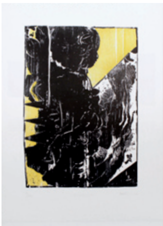
B 7116-05/10 Rahmenmaß 60 x 45 cm Stefan Knechtel, Blendwerk, 2007, Holzschnitt, 47 x 33 cm