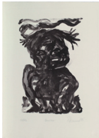
B 6732/04 Rahmenmaß 60 x 45 cm Peter Harnisch, Bauchtier, 1995, Lithografie, 49 x 35 cm