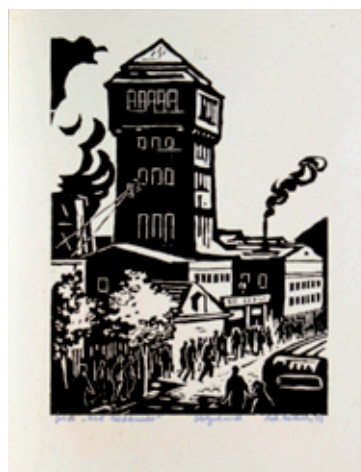
B 5233/86 Rahmenmaß 40 x 30 cm Robert Diedrichs, Grube „Karl Liebkecht“, 1959, Holzschnitt, 30 x 22 cm