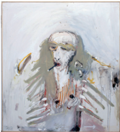
A 1065/12 Rahmenmaß 115 x 104 cm Jean Schmiedel, Letzte Zigarette, 2008, Öl, Mischtechnik auf Leinwand, 111 x 100 cm