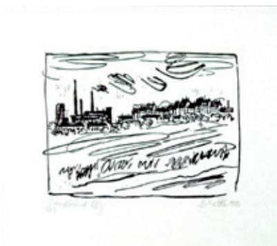
B 0073/75 Rahmenmaß 30 x 40 cm Peter Schettler, Stadttrand II, 1973, Holzschnitt, 16 x 22 cm