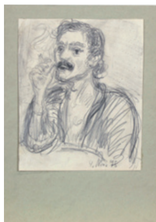
B 3245/83 Rahmenmaß 40 x 30 cm Peter Graf, 4. Nov. 75, 1975, Bleistift und Kohle auf Papier, 22 x 18 cm