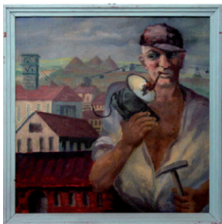
A 0547/85 Rahmenmaß 94 x 93 cm Willibald Mayerl, Der Steiger, 1957, Öl auf Leinwand