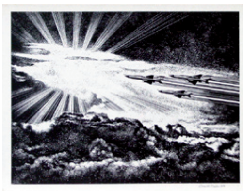
B 5244-06/86 Rahmenmaß 45 x 60 cm Ernst G. Reuter, aus der Folge: Nationale Volksarmee / Luftwaffe, 1971, Siebdruck, 34 x 44 cm