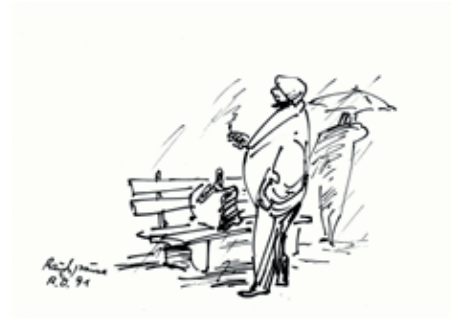
B 7423/15 Rahmenmaß 30 x 40 cm Robert Diedrichs, Rauchpause 1, 1991, Tusche auf Papier, 21 x 30 cm