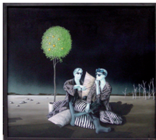
A 0838/93 Rahmenmaß 80 x 90 cm Jürgen Henker, Ausflug ins Grüne, 1988, Öl auf Hartfaser, 72 x 82 cm