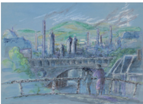
B 5836/90 Rahmenmaß 45 x 60 cm Jürgen Adler, Blick auf Plauen, 1981, Aquarell/Pastell auf Papier, 30 x 42 cm