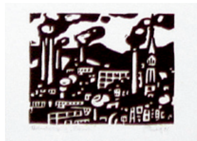
B 6295-11a/96 Rahmenmaß 30 x 40 cm Lothar Rentsch, Rauch, 1985, Linolschnitt, 8 x 11 cm