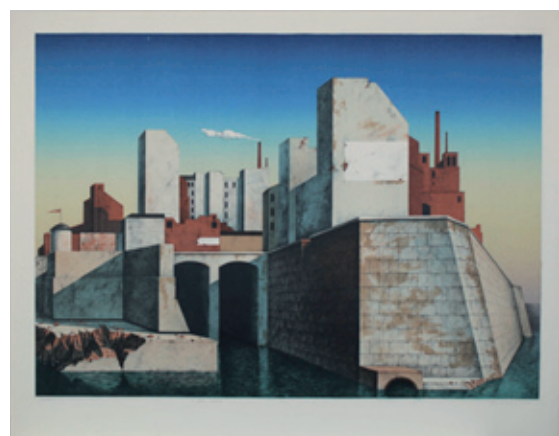
B 1833/82 Rahmenmaß 70 x 90 cm Manfred Kastner, Die Stadt, 1981, Farblithografie, 55 x 70 cm