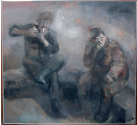
A 0385/83 Rahmenmaß 120 x 130 cm Axel Wunsch, Rauchende Panzersoldaten, 1980, Öl auf Hartfaser, 112 x 121 cm